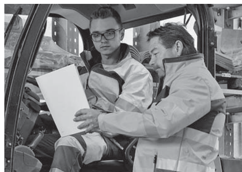
Fig. 1: il personale deve ricevere precise istruzioni sui seguenti aspetti: