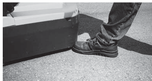
Fig. 3: la minima distanza tra il bordo del telaio e il pavimento (massimo 35 mm) nonché l'uso delle calzature di sicurezza consentono di proteggere al meglio i piedi.