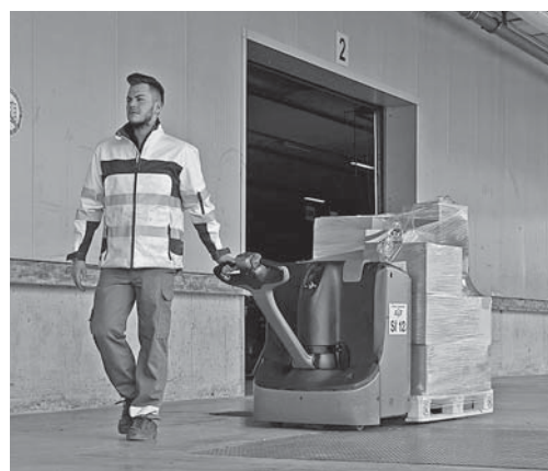
Fig. 4: i carrelli di movimentazione con un timone lungo possono essere guidati con facilità e senza pericoli per i piedi.