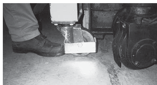
Fig. 2: il copriruota e le calzature di sicurezza proteggono i piedi del carrellista da eventuali lesioni.