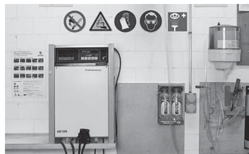
Fig. 5: stazione di ricarica batterie con esposto il cartello di divieto di fumo. Gli occhiali di protezione e la doccia oculare sono a disposizione.

Vedi anche le «Nove regole vitali per l'utilizzo di carrelli elevatori», codice Suva 88830.i